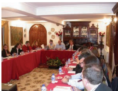
Tavolo di lavoro del partenariato